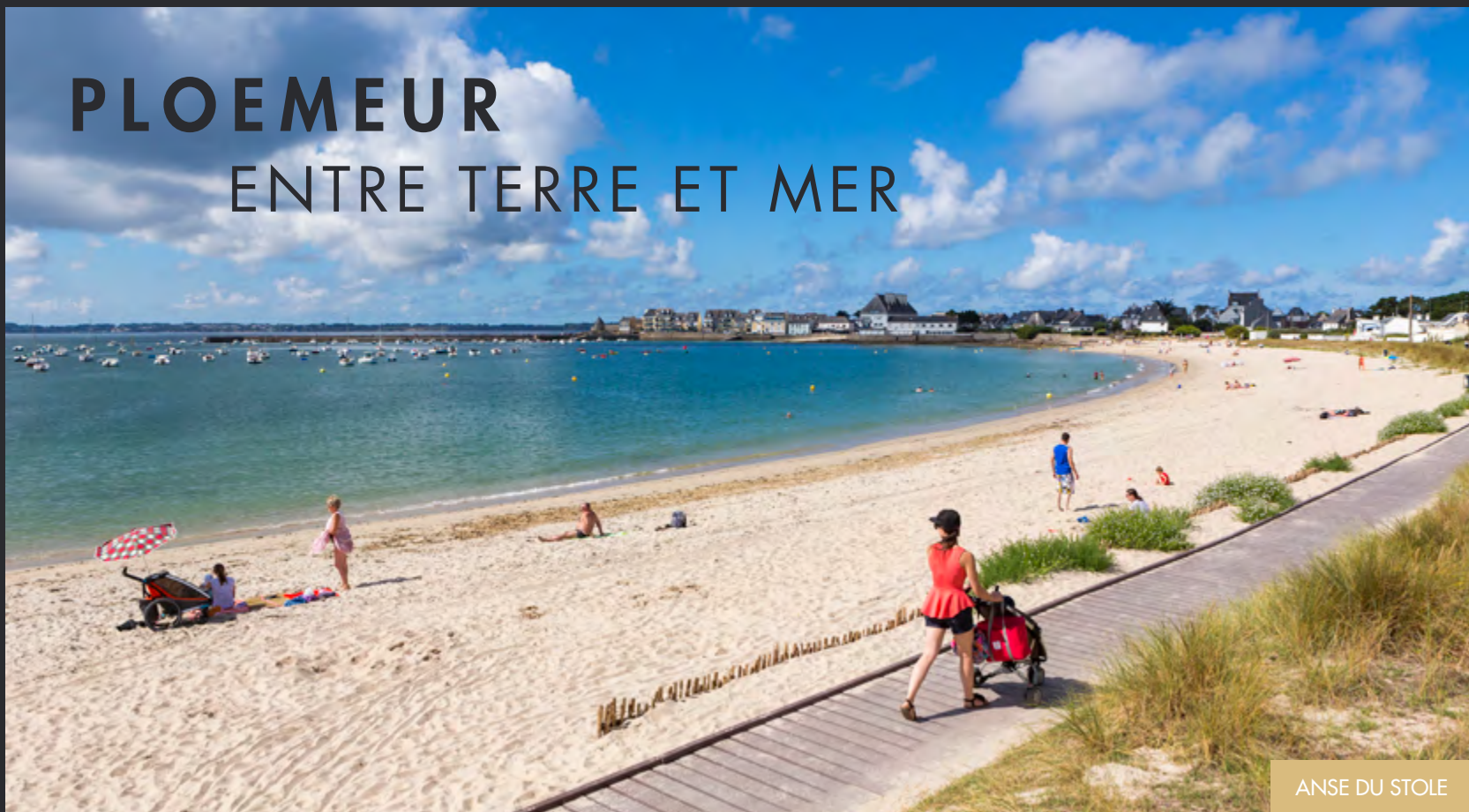
ANSE DU STOLE