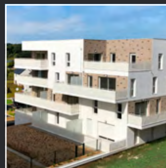
LE 360° - Lanester -