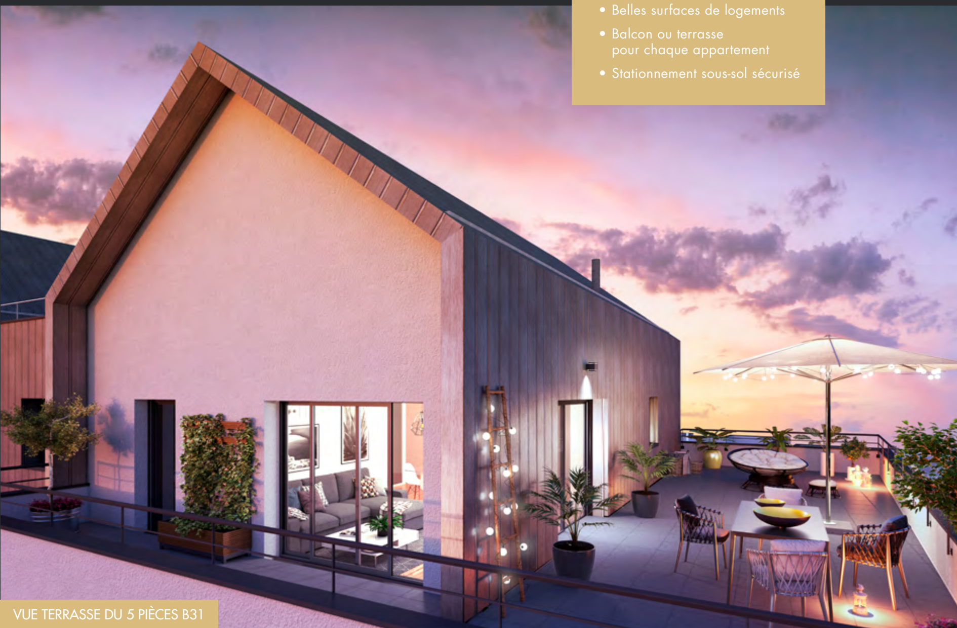
VUE TERRASSE DU 5 PIÈCES B31