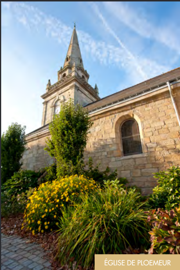
ÉGLISE DE PLOEMEUR