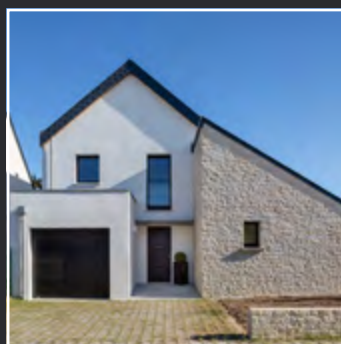
L'ÉCRIN D'AZUR - Quiberon -