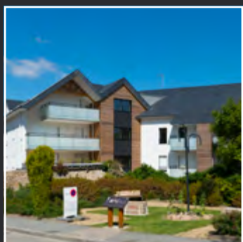
STELLA MARINE - Carnac -

Le First est la 469 e réalisation du Groupe ARC